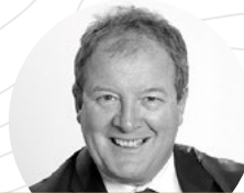
Grégoire Sentilhes Président de Nextstage AM, de Citizen Entrepreneurs et du G20 des Entrepreneurs pour la France

LETTRE DES ETM CHAMPIONNES N°55 / MARS 2017